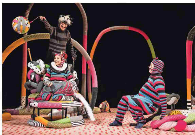
Tista o bolhah ni le predstava o umivanju in reševanju težav z boljšo zalego, ampak tudi o prijateljstvu in tem, da se je treba s problemom spoprijeti.